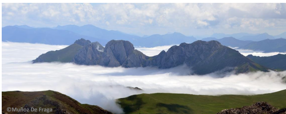
La Tesa, La Mesa y La Almagrera, vistas desde el ascenso a Las Ubiñas, 30/05/2021.

Partiendo del Puerto de La Cubilla , descenderemos por la Vega Rodrigo para subir al collado La Pica , y desde ahí por el valle de la Cruz del Ciego hasta las cumbres de La Mucherona y La Cruz del Ciego . El regreso al Puerto de La Cubilla se realiza por La Boca y la Majada de Carbajal hasta alcanzar la pista que parte del puerto hacia el Pico la Tesa . La ruta no tiene excesivo desnivel de ascenso acumulado, ni es particularmente larga.